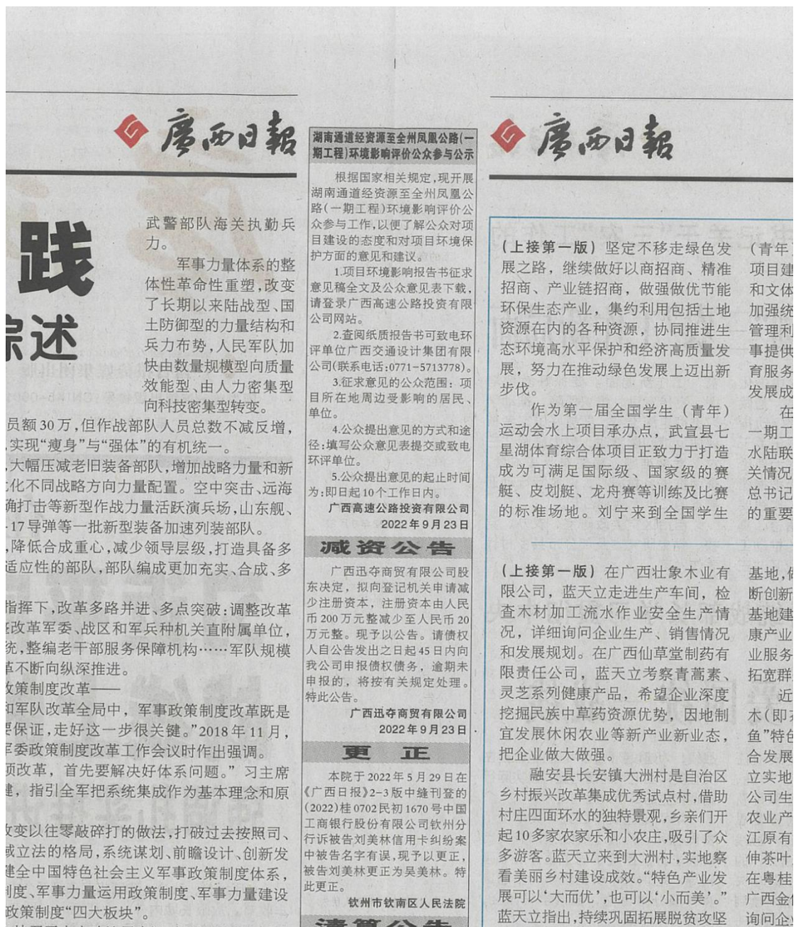
图3 本项目环境影响报告书征求意见稿登报公示照片（第1次）

建设单位于2022年9月23日和2022年9月26日分别在广西日报上公示了本项目的环境影响报告书征求意见稿，登报公示照片见图3、图4。