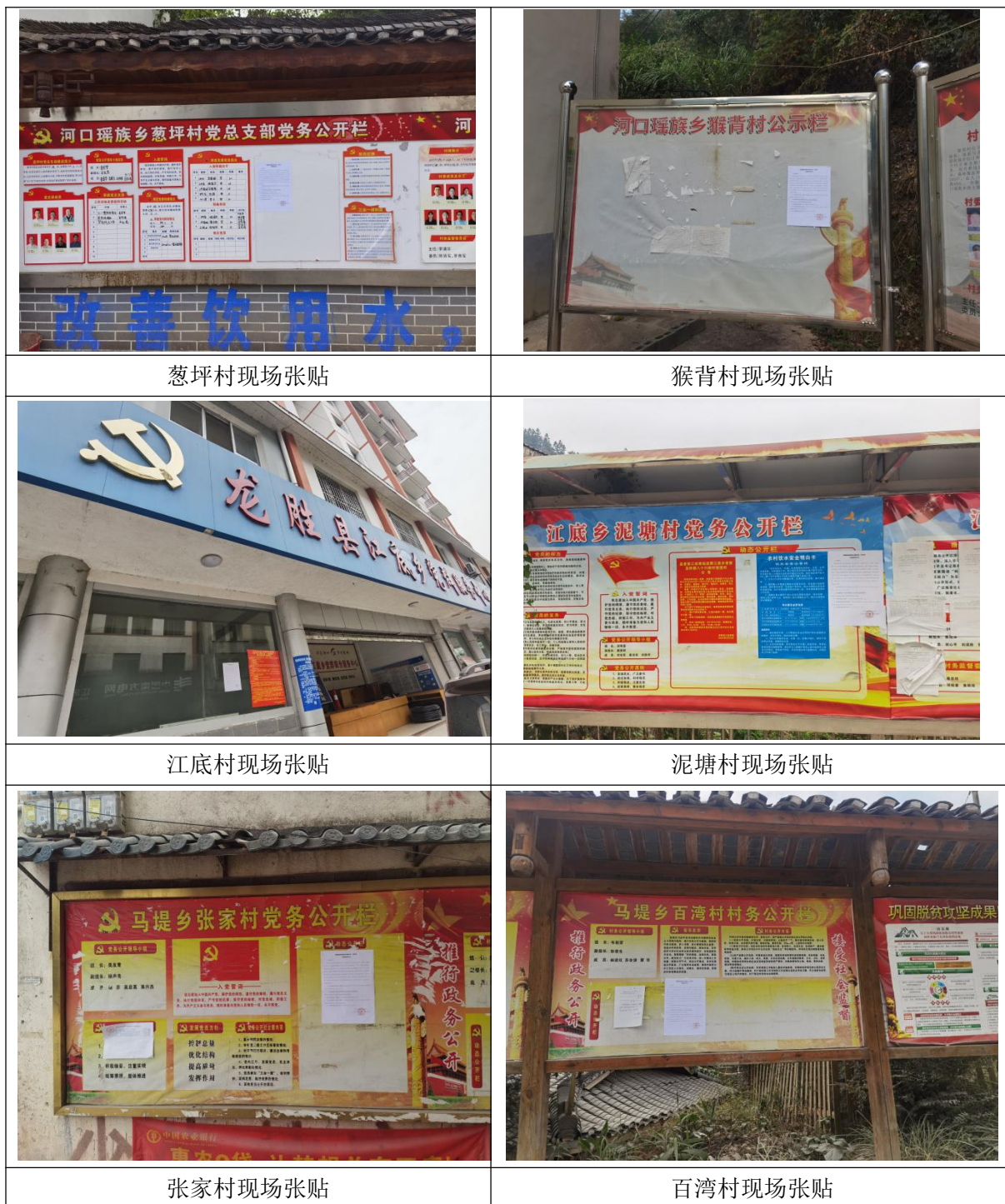
图 5 本项目环境影响报告书征求意见稿张贴情况现场照片