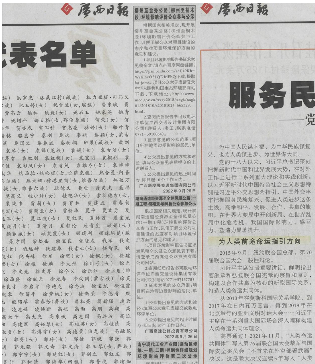
图 4 本项目环境影响报告书征求意见稿登报公示照片（第 2 次）